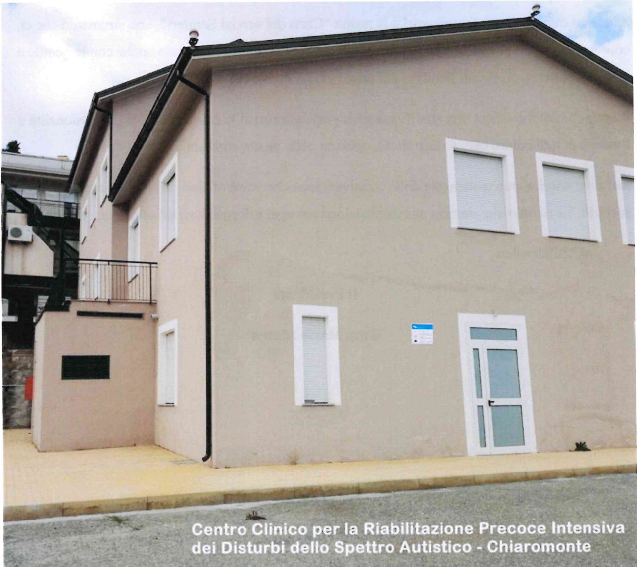
Centro Clinico per la Riabilitazione Precoce Intensiva dei Disturbi dello Spettro Autistico - Chiaromonte

CENTRO DI RIABILITAZIONE PRECOCE DELL'AUTISMO